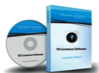
TB Comenius Office